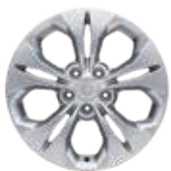
17" aluminium velg