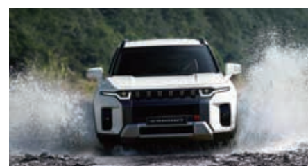
Een diepte tot 300 millimeter waden (bij snelheden tot 30 km/u)