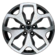
18" aluminium velg Diamond Cut