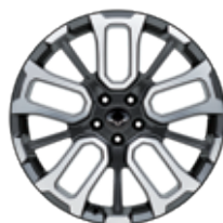
20" aluminium velg Diamond cut