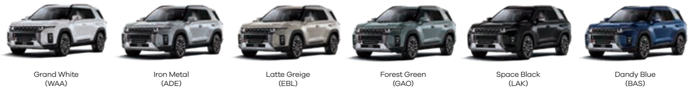
Grand White (WAA)