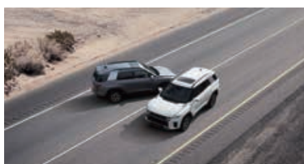
Multi Collision Brake (MCB)