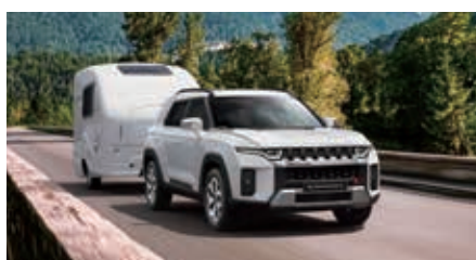
Trekvermogen tot 1500 kg