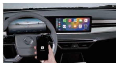
Altijd verbonden met Apple CarPlay en Android Auto