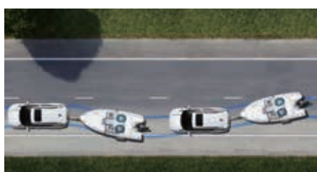
Trailer Sway control

Waar de lokroep van het avontuur je ook heen leidt, je komt altijd veilig aan op je bestemming en weer thuis. Door innovatieve, slimme technologieën te integreren in een origineel en authentiek ogende SUV biedt de Torres een uitgebreid pakket geavanceerde rijhulpfuncties. Zowel voor zijn bestuurder als voor zijn passagiers is de Torres een van de veiligste en meest ontspannende auto's om in te rijden en te reizen.