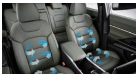
Geventileerde zetels vooraan