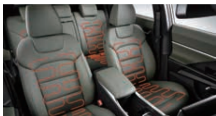
Verwarmde zetels voor-en achteraan