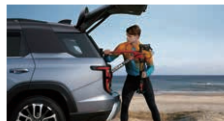
Elektrisch bediende achterklep

In de geest van het paradijselijke Torres del Paine, diep in Zuid-Amerika, geeft de Torres je het vertrouwen om te gaan en te staan waar je wilt, en inspireert hij je om hoger en verder te gaan om nieuwe horizonten te verkennen.