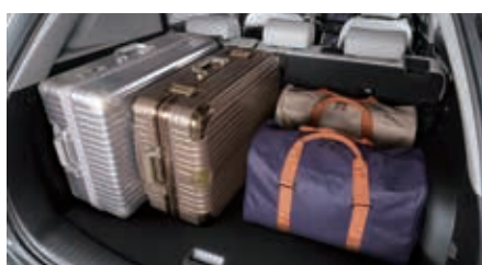
703 liter laadvolume